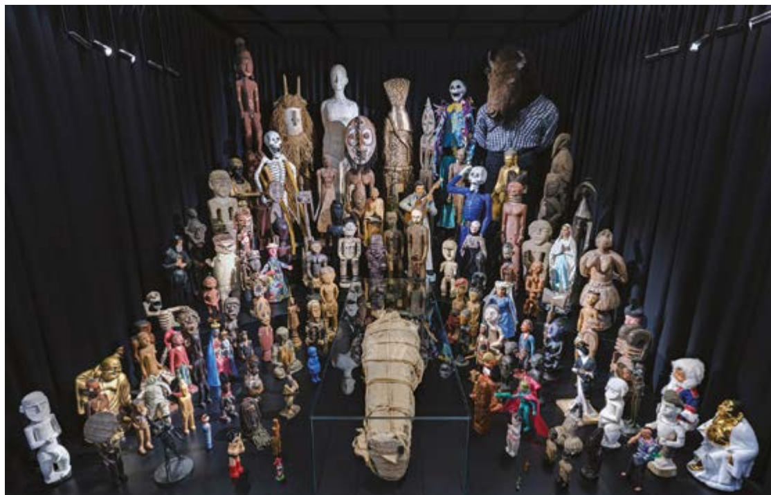
Espace 02 – AU-DELÀ 1 er dans l'exposition L'impermanence des choses