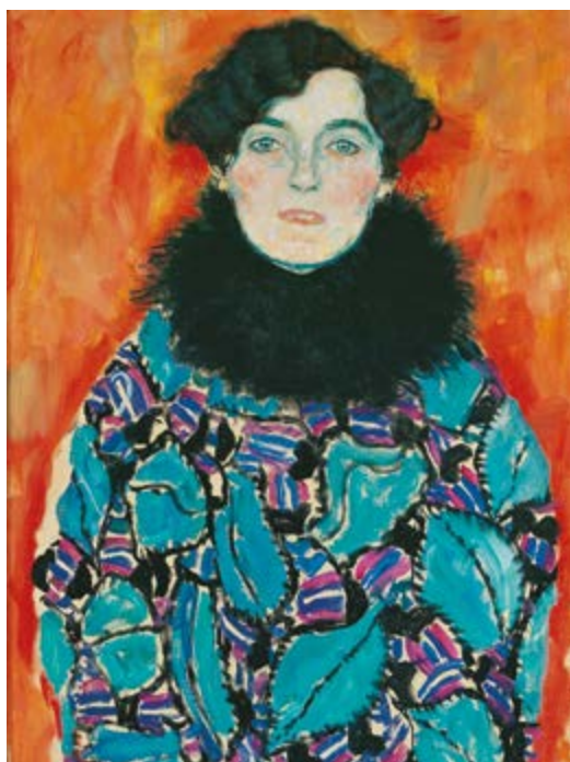
Gustav Klimt, Johanna Staude 1917-1918 Huile sur toile 70 x 50 cm