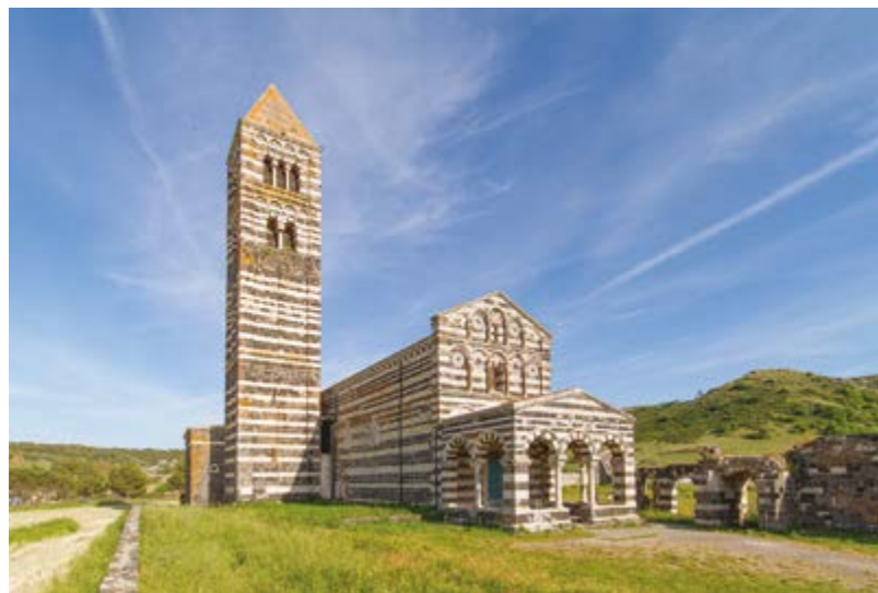
Basilique de Saccargia

Du sud au nord, de la capitale Cagliari à Porto Torres , en passant par Nora , Oristano , Bosa et Alghero , les routes sardes conduisent aux villages perchés et aux nombreuses églises construites en pierre locale souvent au milieu de