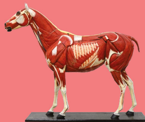
Cheval écorché, carton peint. Allemagne, 19 e s.