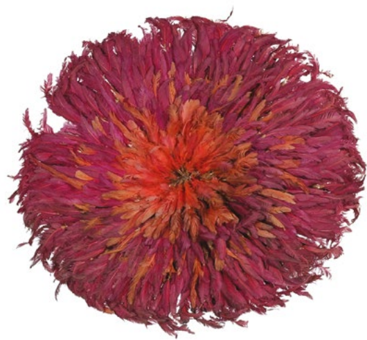
Coiffe Bamiléké, Plumes. Cameroun, 20 e s.